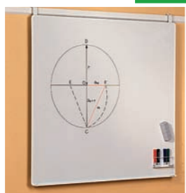
Schreibtafel (70 cm, 120 cm, 150 cm und 180 cm breit)