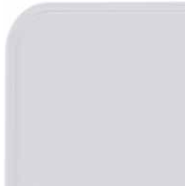
Emaille - Weiß