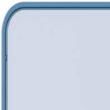
Emaille - Blau