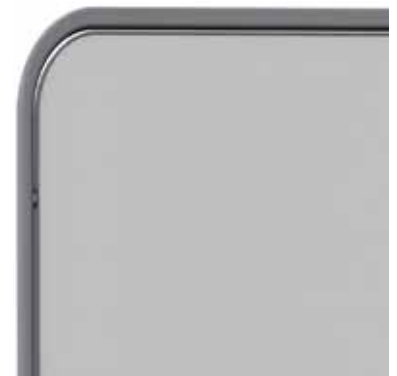
Emaille - Grau